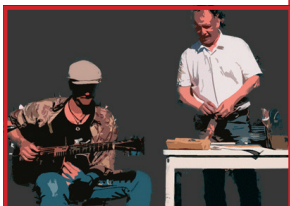
BLUES 'N FOOD